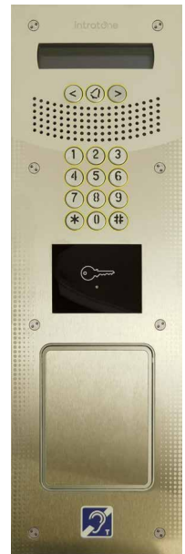
Avec coffre à clés intégré